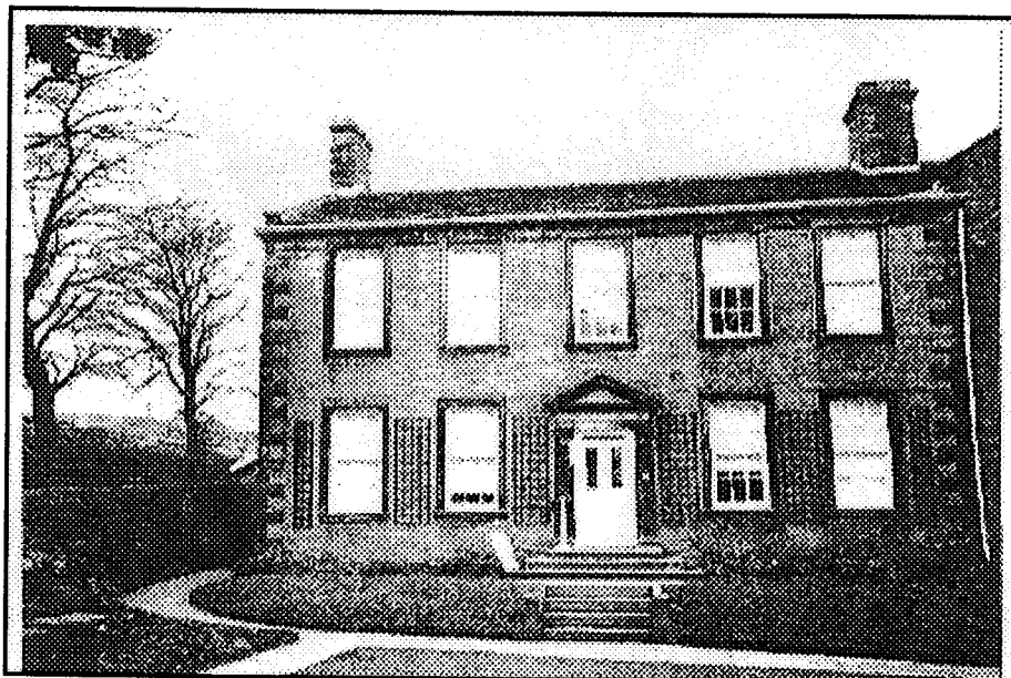
The Parsonage at Haworth